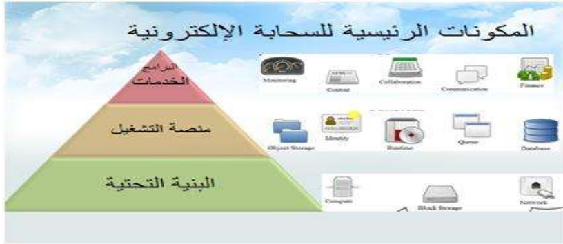
شكل (١) المكونات الرئيسية للسحابة

والشكل التالي يوضح طبقات الحوسبة السحابية الثلاثة