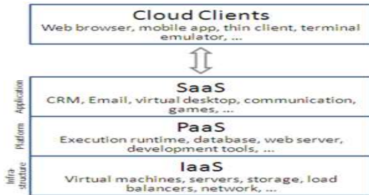
شكل (٢) أنواع الخدمات السحابية

و للتعامل مع تقنية الحوسبة السحابية لأبد من توافر مجموعة من العناصر تتمثل في: (المستفيد أو العميل Client- المنصات Platforms- البنية التحتية Infrastructure- التطبيقات Application)