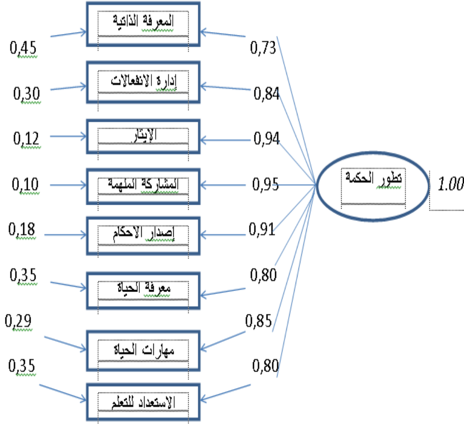
شكل (٢) البناء العاملي لمقياس تطور الحكمة

وقد قام الباحث بحساب صدق المقياس على درجات (١١٦) طالب وطالبة من طلاب الجامعة باستخدام طريقة صدق المفردات وذلك بحساب معامل الارتباط بين درجة كل عبارة والدرجة الكلية للبعد الذي تنتمي إليه بعد حذف درجة المفردة، فتراوحت قيم معاملات الارتباط التي تم التوصل إليها بين (٠.٦٤-٠.٩٣) وهي قيم مرتفعة وموجبة وتشير إلى صدق المقياس. ■ ثبات المقياس: قام مترجما المقياس بحساب ثبات المقياس باستخدام أسلوب إعادة التطبيق، وطريقة ألفا كرونباخ على عينة (١٣٨) طالب وطالبة من طلاب الجامعات بفارق زمني قدره (٣٤) يوم بين التطبيق الأول والتطبيق الثاني، وقد تراوحت قيم معاملات ثبات المقياس بين (٠.٨٣-٠.٨٩) باستخدام طريقة إعادة التطبيق، وبين (٠.٧٨-٠.٨٣) باستخدام ألفا كرونباخ، وهي جميعها قيم موجبة ومرتفعة، مما يشير إلى أن المقياس يتمتع بدرجة مرتفعة ومرضية من الثبات.